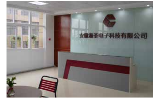
安徽瀚荃電子科技有限公司

瀚荃公司的經營理念為：積極、創新、效率。透過「積極」、「創新」及「效率」的核心價值，開發高附加價值產品，創造永續發展契機。在追求營收與獲利的同時，積極推動企業社會責任，於社會的各項承諾，包括勞資關係、員工照