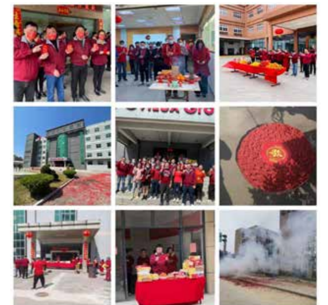
大陸各廠員工新春集錦