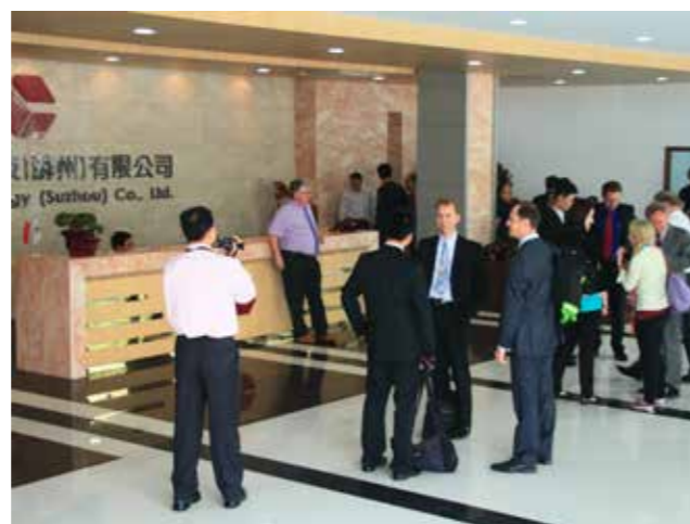
2009 蘇州對海外經銷商大會

以淡水為營運總部，目前生產據點分別設於台灣淡水和大陸東莞、蘇州、重慶、安徽及東協寮國。客戶包括國際知名大廠，銷售地區橫跨歐、亞、美三大洲，