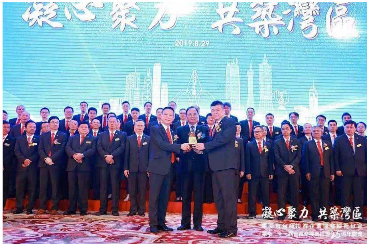
擔任東莞市台商投資企業協會厚街分會會長及東莞市台商投資企業協會常務理事