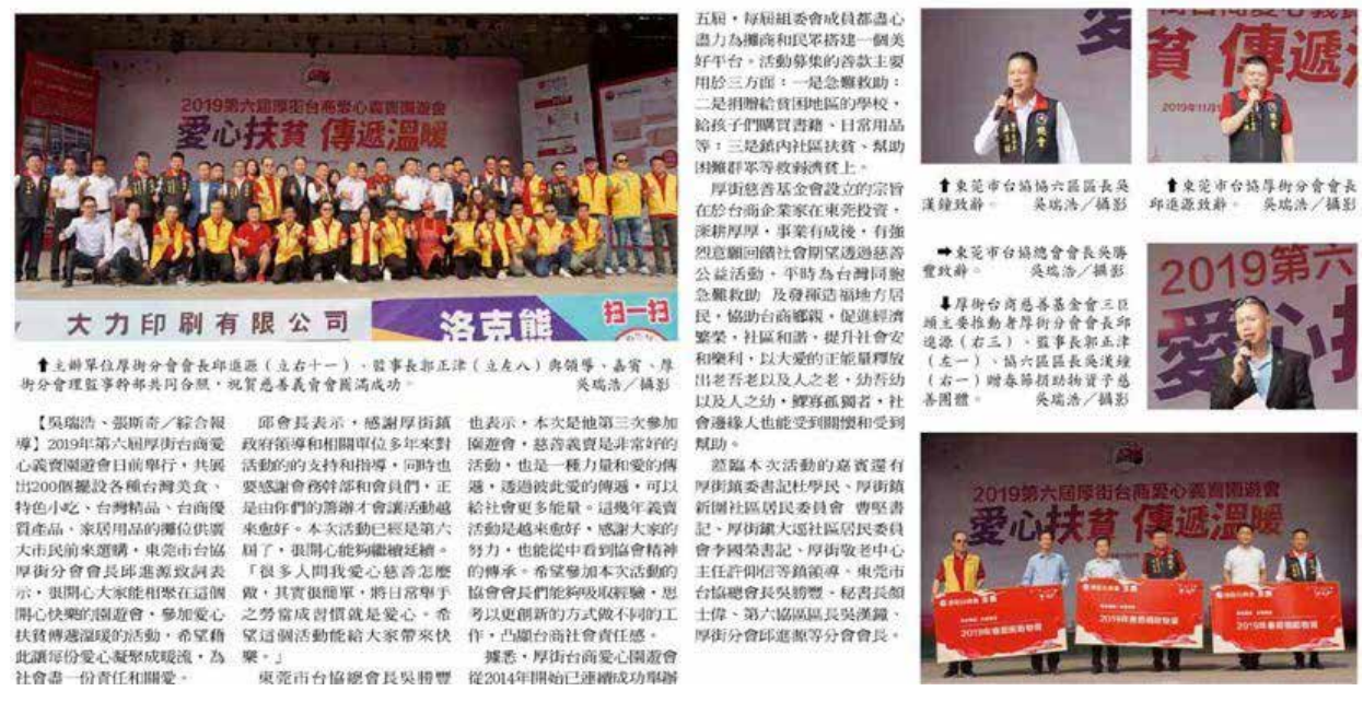
愛心慈善園遊會報導