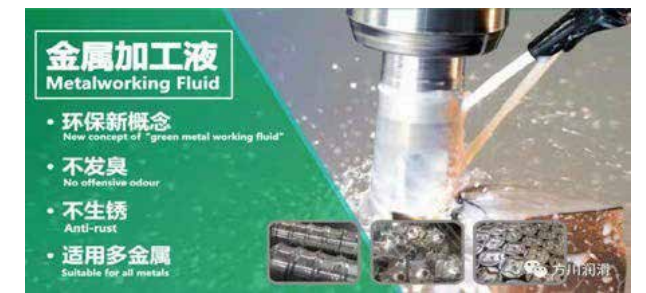
綠色產品 - 環保金屬加工液圖

創業的過程中當然有成功的喜悅，也有失敗的心酸，剛開始也是代理荷蘭皇家殼牌的潤滑油，但遇到了很大的困難。當時的東莞市場，荷蘭皇家殼牌潤滑油的仿冒品很多，銷售價格甚至低於正牌的成本價。於是在2000年，我跟隨大哥一起在東莞萬江開始投資華信石油化工有限公司，並建立2萬多平米的廠房，準備自己生產，降低成本，提升競爭力。2002年生廠