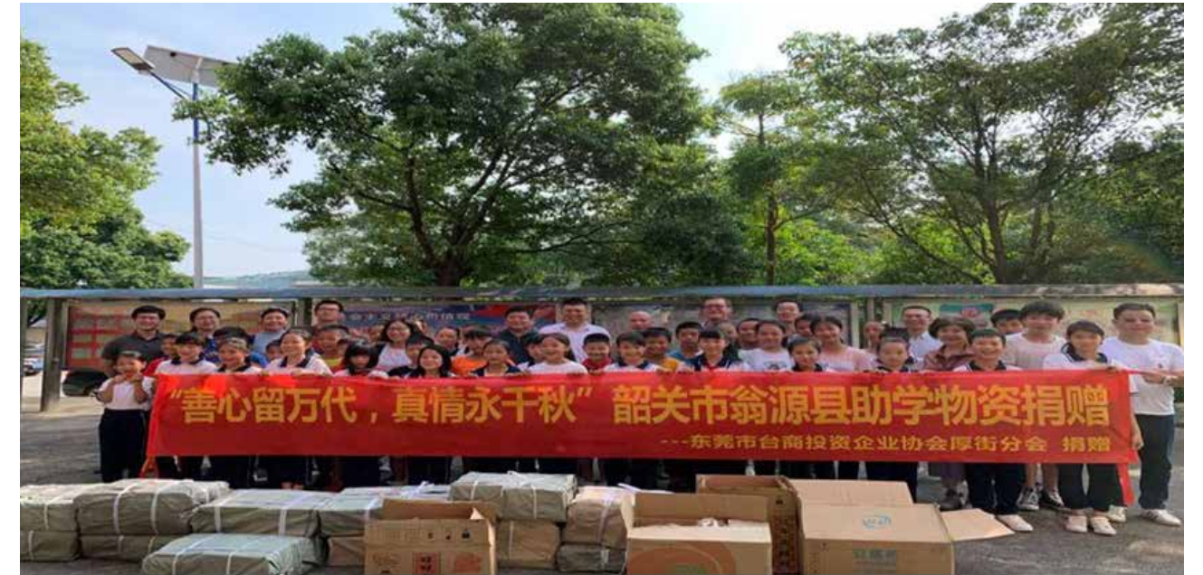
貧困學校助學物資捐贈

同時公司也積極培養具備專業特色的人才，組建團隊明確職責、分工定位及團隊協作，在平時多收集底層資料，進行統計分析，再對結果做視覺化展示，提供經營團隊作為決策參考，進而協助負責人準確定位，創造出非凡的業績，提升在行業內優勢，並體現出創新模式、業務模式、運營模式、獲利模式。