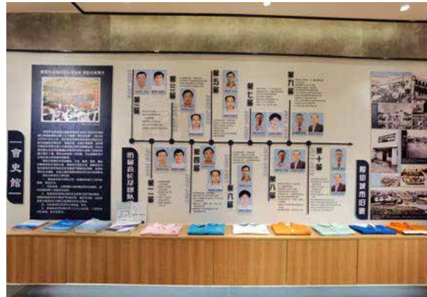
厚街台商會史館歷屆會長