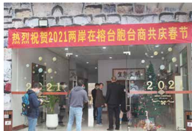
兩岸在榕台胞共度春節