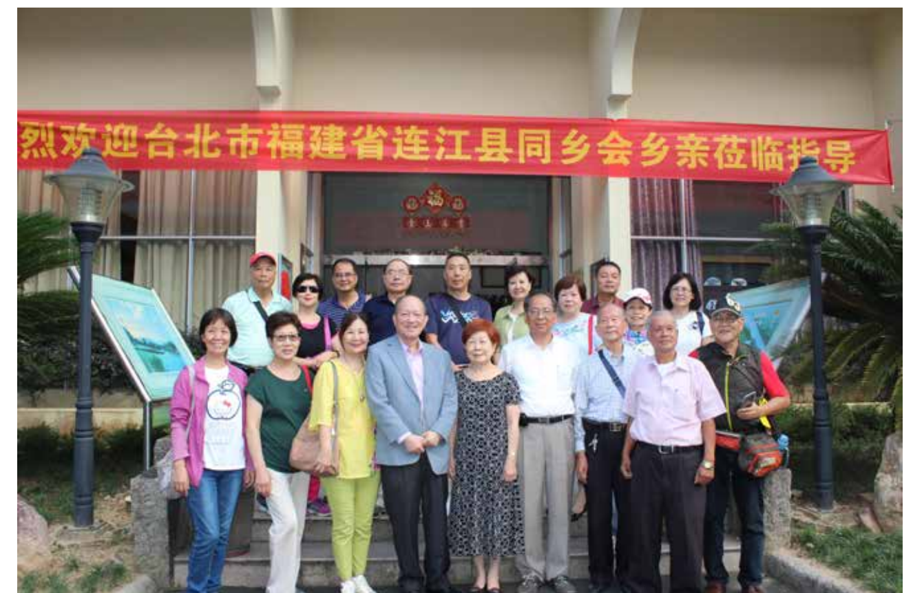
台北福州同鄉會參訪聯誼

作為福州台協會長，福州台協將持續努力，不斷成長進步。不忘初心，在昔日歷任會長所建立的堅實基礎上，凝聚台企、台胞之力，彙集台企、台胞之智，為福州台協會的發展壯大、所有台企、台胞們的美好明天努力拚搏！「積力之所舉，則無不勝者；眾智之所用，則無不成者」。