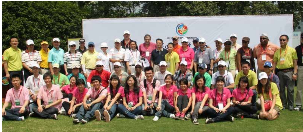
2011 年外交使團系列體育活動