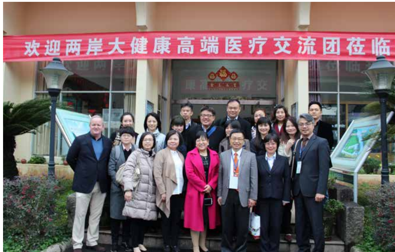
兩岸大健康高端醫療交流